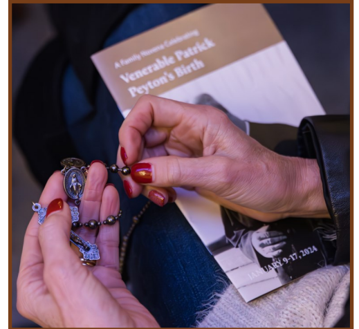
Participation à la prière de la neuvaine célébrant la naissance du Vénérable Patrick Peyton.