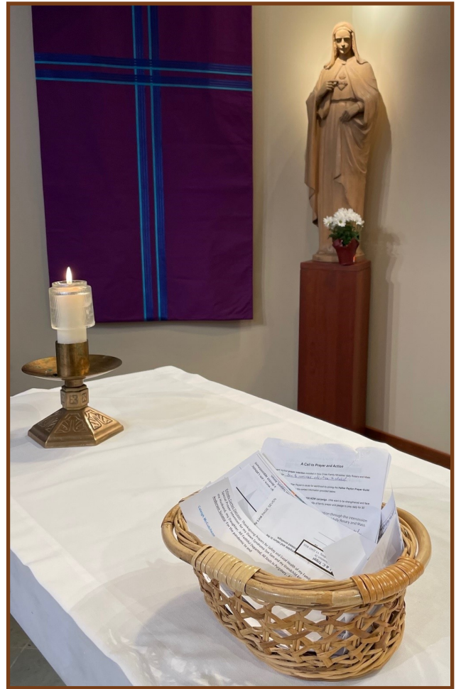
Oraciones solicitando la intercesión del Venerable Patrick Peyton en la Capilla de Nuestra Señora del Santo Rosario.

P.D.: Copias extra del folleto de la Novena en Familia pueden descargarse en: FatherPeyton.org