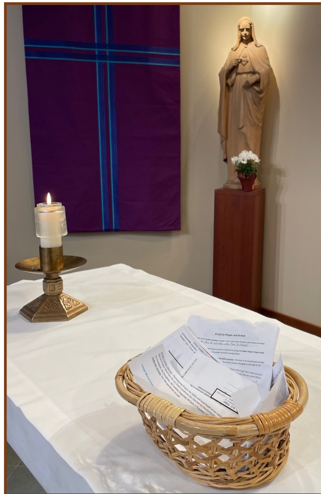
Bulletins de prière pour l'intercession du Vénérable Patrick Peyton à la chapelle de Notre-Dame-du-Saint-Rosaire.

P.S. : Vous pouvez télécharger des exemplaires supplémentaires de la Neuvaine familiale sur : FatherPeyton.org