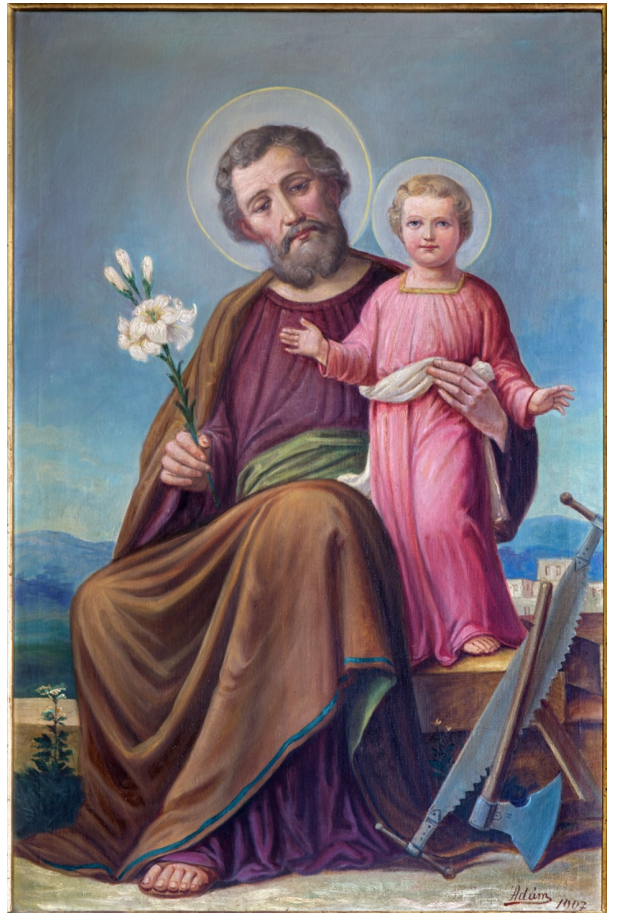
« St Joseph avec le Christ Enfant. » Par un artiste slovaque, 1907.