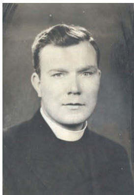
Fecha y lugar de nacimiento: 9 de enero de 1909; Attymas, County Mayo, Irlanda

La oración en familia invita a Dios a los hogares y a los corazones de las familias como la fuerza más poderosa del cielo o de la tierra. Es la oración en familia la que une a la familia en lazos inquebrantables de amor, paz, confianza y alegría. El padre Peyton lo resumía bien cuando decía: "La familia que reza unida permanece unida".